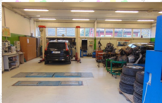
Korszerű autószerelő műhely