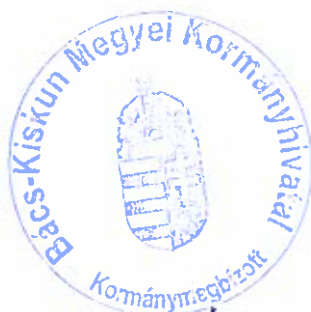
Kovács Ernő Kormány megbízott Bács-Kiskun Megyei Kormányhivatal