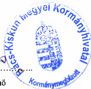
Kovács Ernő Kormány megbízott Bács-Kiskun Megyei Kormányhivatal